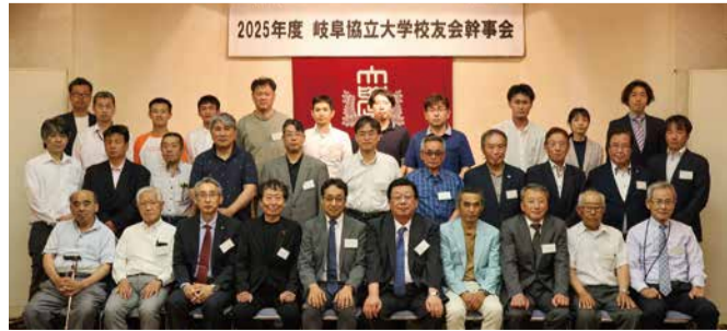
2025年度 岐阜協立大学校友会幹事会