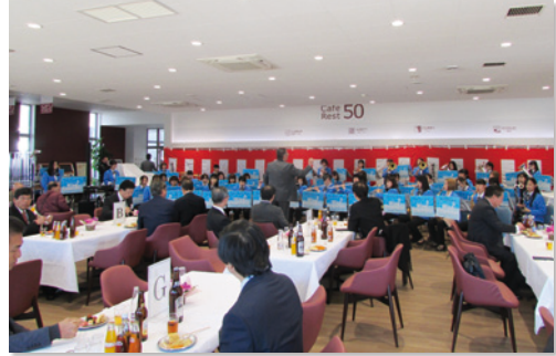
▲大垣女子短期大学ウインドアンサンブル